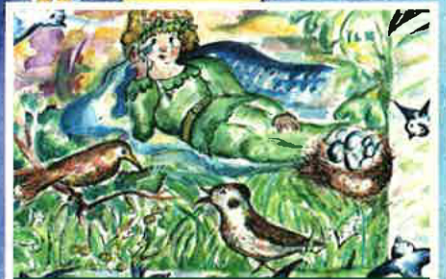
Roue an Nevezamzer