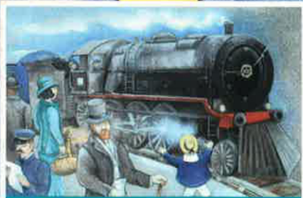
Bevet an hent-houarn