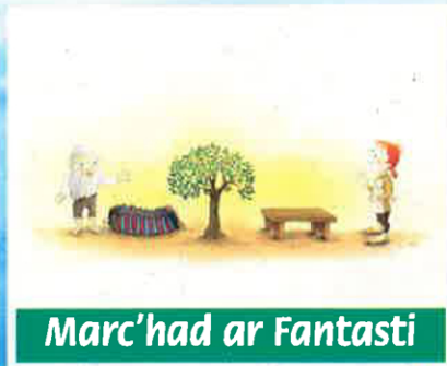
Marc'had ar Fantasti