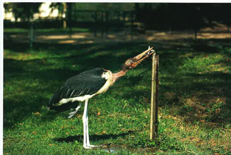
◁ OPPORTUNISTE, l'un d'eux profite d'un robinet mal refermé pour s'abreuver.

les entrailles des carcasses - en fait un oiseau plutôt déplaisant. Mais, à Kampala, les marabouts font depuis plusieurs années partie du décor.