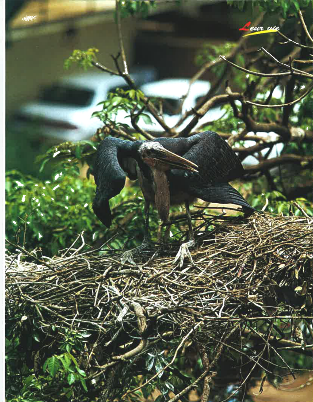
△ DE JANVIER À AVRIL, les marabouts s'installent dans les arbres de la ville pour nidifier.

K ampala, capitale de l'Ouganda, accueille un hôte généralement plus habitué des savanes que des villes. Lorsqu'on arrive à proximité de la ville, on voit immédiatement tournoyer dans le ciel de grands oiseaux ressemblant à des vautours. Mais il n'en est rien. La confusion provient de l'attitude en vol de ces grands oiseaux qui planent la tête enfoncée entre les épaules et qui jouent très habilement avec les courants d'air chauds ascendants. Ces habitants particuliers sont des marabouts. Si le marabout est un excellent et très gracieux planeur, il n'en demeure pas moins un oiseau qui, au sol, se déplace avec beaucoup de noblesse. Néanmoins, l'élégance de cette grande cigogne se limite à ses modes de déplacement. En effet, son physique d'oiseau à la tête et cou roses et dénudés - adaptés à fouiller