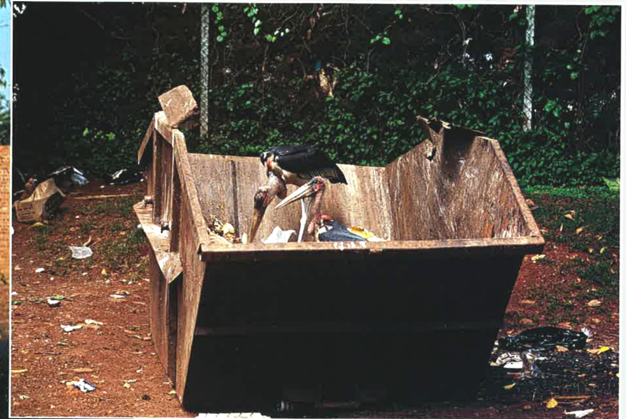
△ LES DÉCHARGES PUBLIQUES, les bennes à ordures, et surtout l'abattoir de la ville, les attirent particulièrement.

trop important et une véritable campagne d'extermination fut menée. Prélèvement des œufs, destruction des nids et chasse des oiseaux avaient considérablement fait diminuer leur population, mais différentes associations de protection de la faune ont fait arrêter le massacre avant leur disparition totale. Aujourd'hui, les marabouts ont à nouveau colonisé la capitale. Chaque année, de janvier à avril, les arbres de la ville accueillent des centaines de couples qui nidifient.