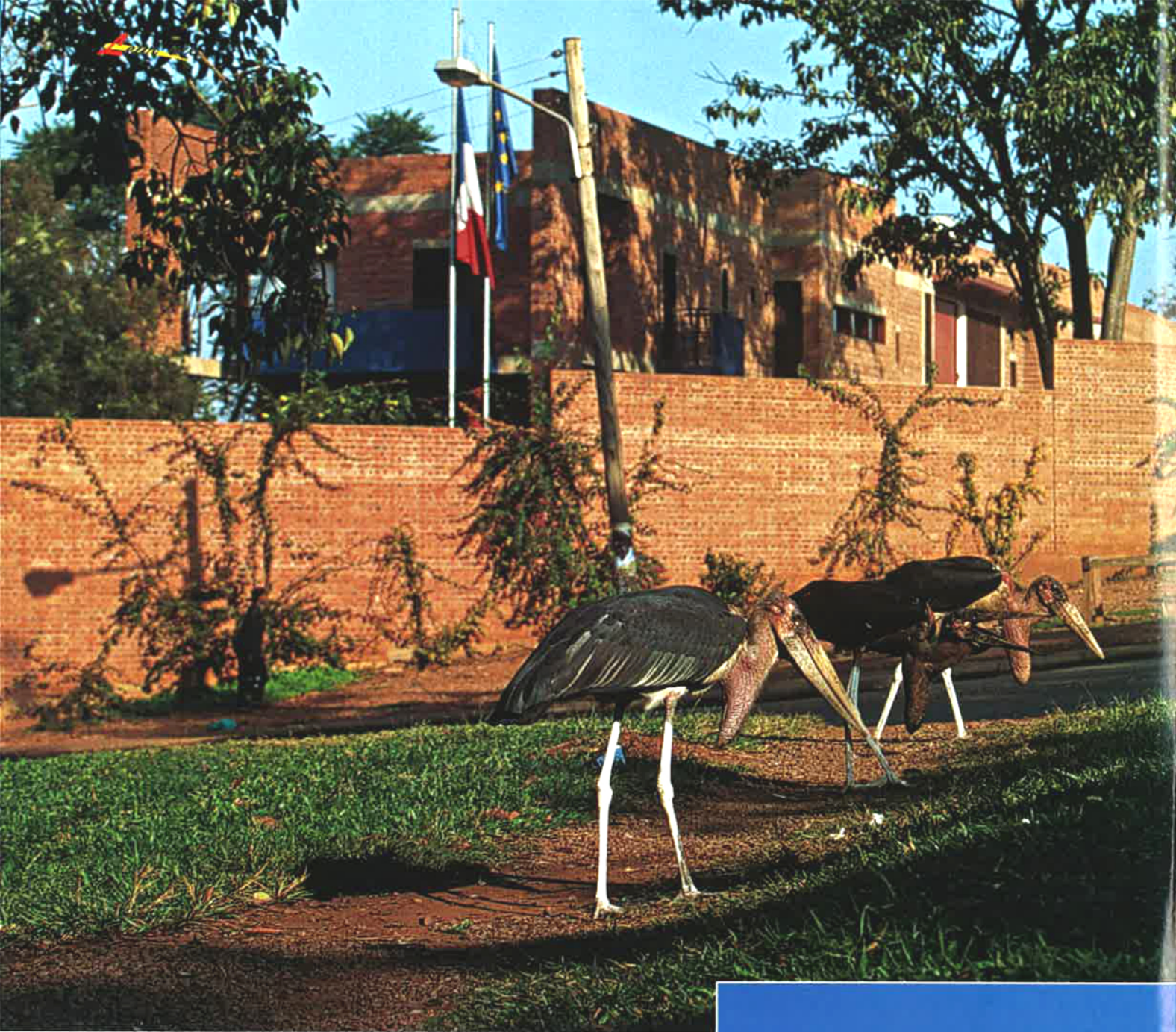
△ DANS LA RUE QUI PASSE devant l'Ambassade de France, trois marabouts se gavent de fourmis ailées.