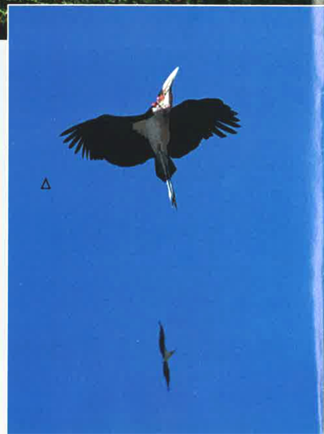
▷ DANS LE CIEL, cet oiseau d'apparence peu gracieuse déploie une élégance inattendue.

immeubles, ils sont partout. En Afrique, les marabouts ont un grand nombre de surnoms, « frac », « conseiller privé » ou encore « l'adjutant ». Ils sont une véritable institution et font l'objet de légendes et contes traditionnels. Cela provient très certainement de la posture tranquille qu'ils adoptent une fois rassasiés. Seul un claquement de bec