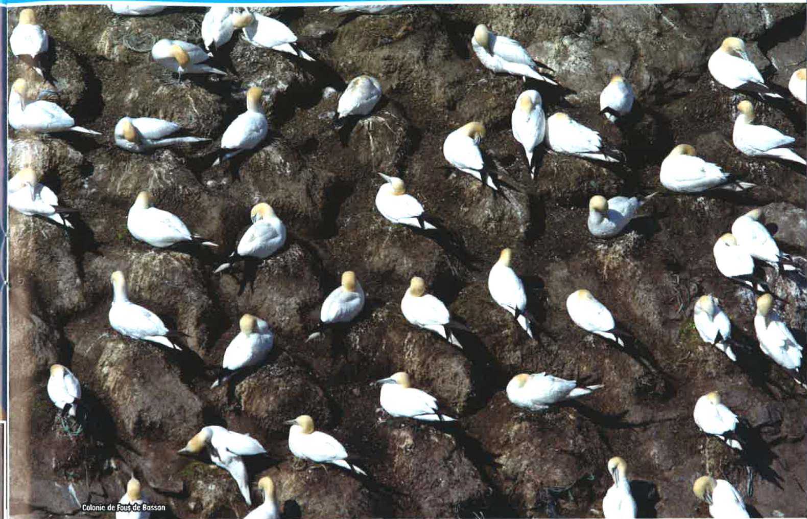
Colonie de Fous de Bassan