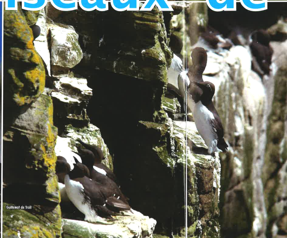
Guillemot de Troie

Comme chaque année les mois de mai et juin marquent l'installation et la ponte de la plupart des oiseaux marins. Certains, arrivés sur les sites de nidification dès le mois de février, ont déjà installé leur nid. D'autres s'affairent à sélectionner et conquérir leur mètre carré de territoire ou la corniche qui accueillera leur progéniture. Tous n'ont qu'une idée en tête : se reproduire. Alors commence le balai d'intimidations, de chamailleries mais aussi de charmes auxquels se livrent les mâles pour constituer leur couple.