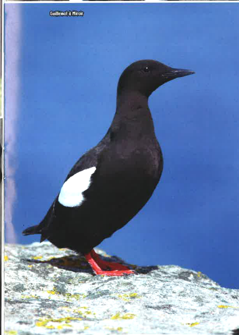
Guillemot à Miroir