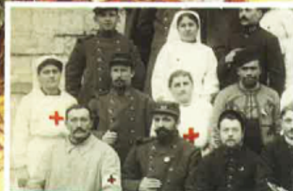
Istòria : Henri Dunant