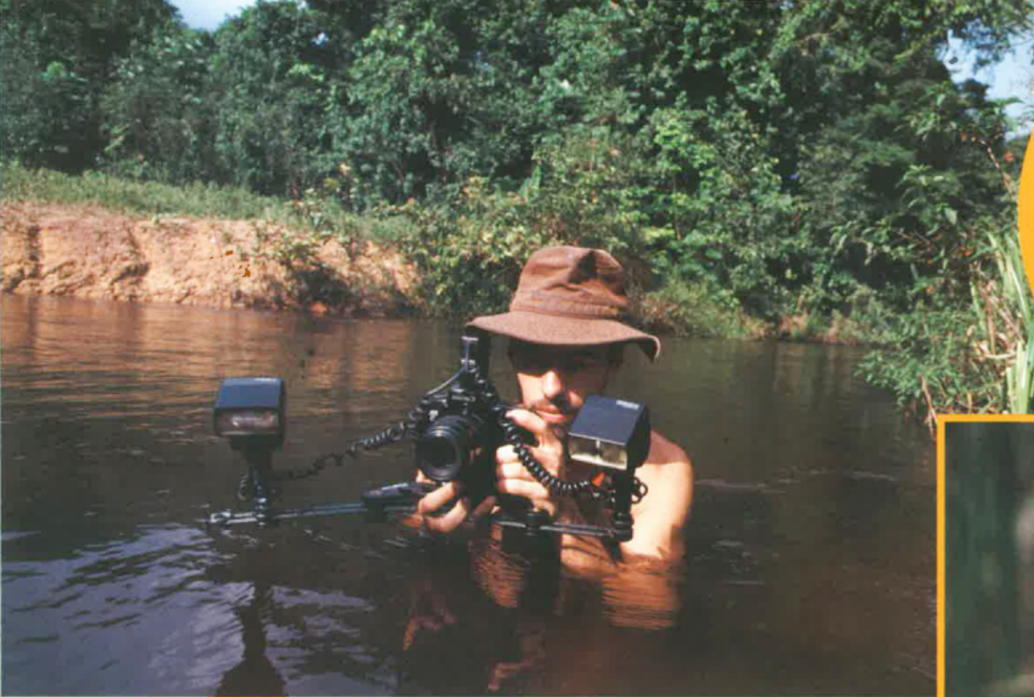
Tèxte e fòtos de Frédéric Lavail.

Que t'arriba de léger e d'espiar reportatges animalèrs. Las fotografias l'aqueths reportatges que son hèitas per fotografes especializats. Uei, un d'aqueths que't ditz uns secrets deu son mestièr.