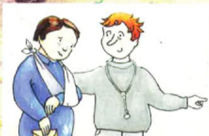
Un conte de mètge