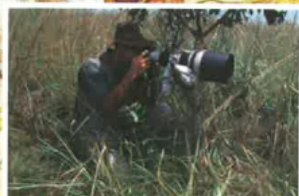
Fotografiar las bèstias