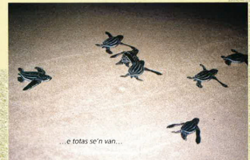
...e totas se'n van...