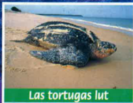
Las tortugas lut