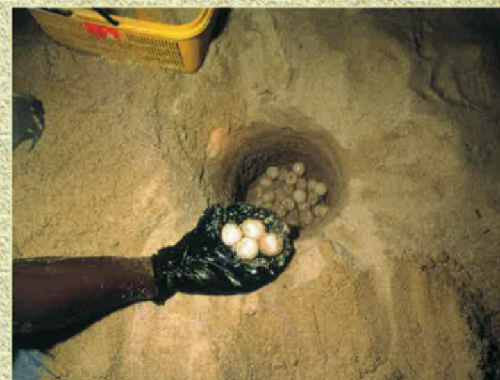
... pausar los uòus...