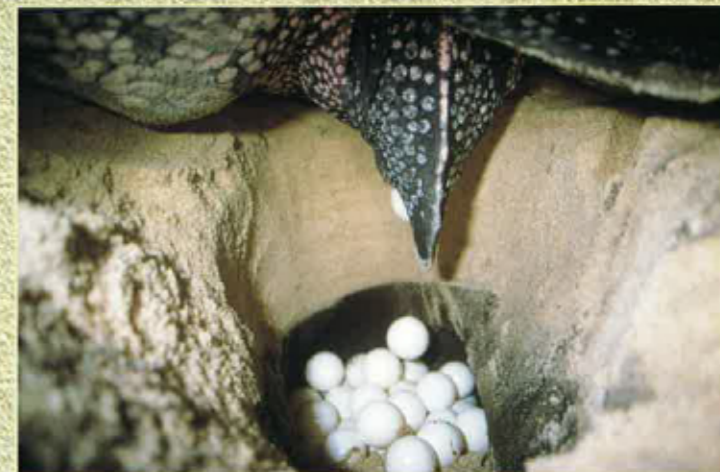
... un centenat d'ueus...

La tortuga lut fa partida de l'òrdre dels quelonians, un òrdre que i aviá sus Tèrra abans los dinosaures. Benlèu viu ara las siás darrièras annadas.