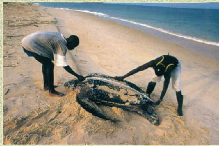
... mesurar la tortuga...

Plan segur, es malaisit que la tortuga se daissa pas far. Pr'aquò, es important de pausar aquelas bagas que permeton d'identificar cada animal. Aital se coneis las mensuracions de la tortuga e se pòt veire las evolucions d'una annada a l'autra. Es aital tanben que se sap se las tortugas van pondre dins mai d'un siti e quantes de còps i van. S'es pogut observar pondre al Gabon una tortuga qu'èra estada bagada dos ans abans en Guiana ! Fa veire que las tortugas lut son de grandas viatjairas !