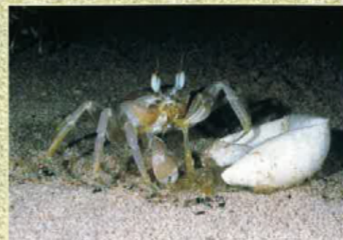
Un cranc manja un uòu

Las tortugas lut pòdon arribar a 1,95 m de talha per un pes de 900 kg. Son de nadairas de primièra, pòdon far al ras de 50 km de l'ora e son capablas de nadar sus 800 km en 20 jorns per arribar al siti de ponda.