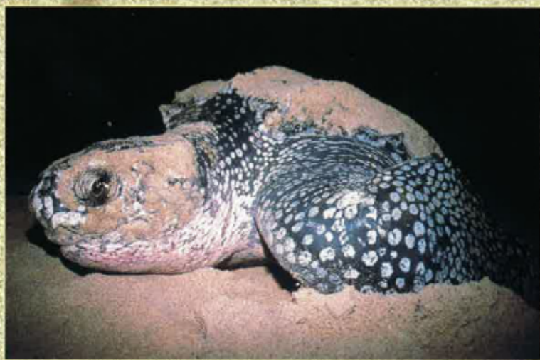
... pondre uòus...

Tanlèu pondut, tornan barrar lo nis menimosament e passan mai d'un còp dessús per esfaçar las traças, que se torne pas trobar los uòus. Solament arriba que los crancs caven de galariás per s'emparar dels uòus. Quand ne tròban un, lo tornan montar defòra e lo trincan amb la pinça per manjar lo mojòl. Lo trabalh dels benevòls es de recaptar los uòus e de los portar dins un pargue barrat de tela d'aram per los aparar