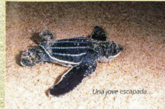
Una jove escapada...