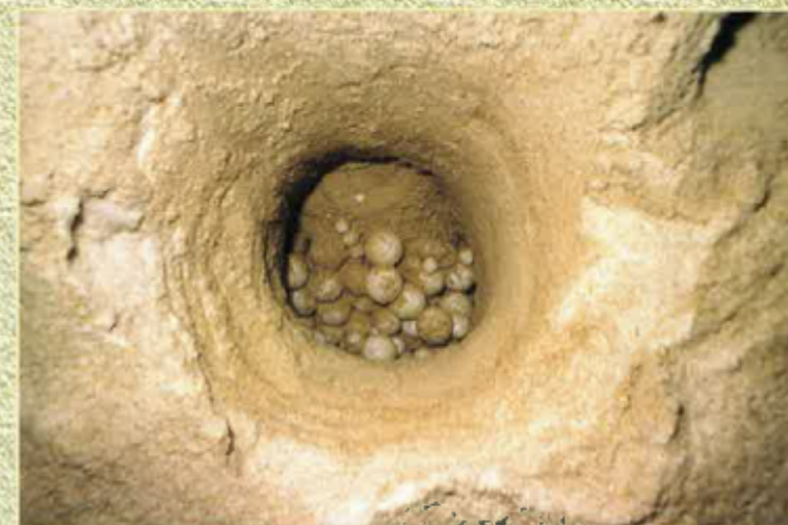
Far un trauc a l'abric...

Sus tèrra son plan pus malbiaissudas. Lor cal de doas oras e mièja a tres oras per pondre. Per començar, cèrcan los melhors endreches per cavar lo nis. Un nis prigond de 60 a 80 cm que cavaràn amb las aletas de darrièr. Pondràn al ras de 140 uòus de 5 cm de diamètre. A la sason de la ponda, las femèlas pòdon pondre mai d'un còp, d'unas que i a, un desenat de còps.