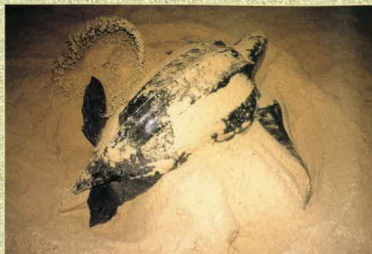
Cavar lo nis...

D'estudis scientifics recents fan veire que las poblacions de tortugas lut declinan. Son victimas dels fialats de pesca o dels sacs de plastic que manjan perque los confondon amb de medusas. Riscan de desaparéisser. Per empachar aquela catatròfa, d'associacions d'un pauc pertot dins lo mond ensajan de las aparar. Es lo cas de Gabon, ont los 800 km de plaja del país ne fan lo segond siti de ponda de las tortugas lut dins lo mond.