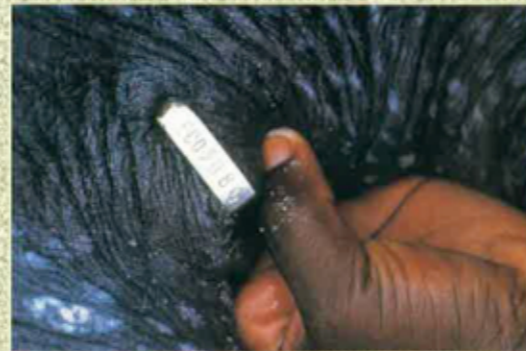
La baga pausada.