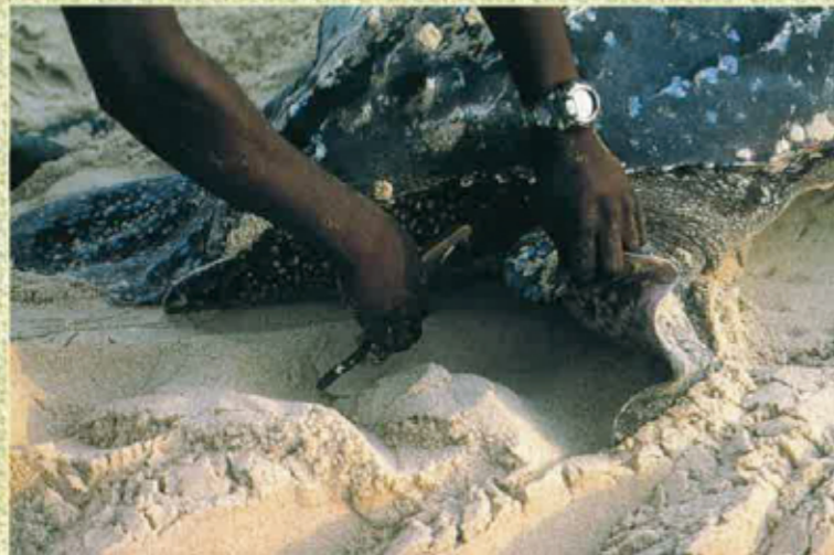
... bagar l'aleta.

Un còp acabat de pondre, la tortuga pòt tornar a la mar. Cal esperar de 60 a 70 jorns per que los pichons nascan. De 140 uòus naisson al mens 70 tortugons. Pauques arribaràn a far de tortugas. De còps, sòrton del sable al bèl mièg de l'après-miègjorn e resistisson pas de tant caud qu'es lo sable a la raja del solelh d'Àfrica. Arriba que los gavians los vengan manjar. La nuèch, son los crancs tornar mai que los atrapan sens qu'ajan cap d'espèr de se salvar. Los perilhs contunhan dins l'aiga, amb los peisses que los velhan per los manjar. S'estima que sus 1 000 tortugas nascudas una arribarà a l'edat adulta. E la tortuga lut se pòt pas reproduir qu'a partir de dotze ans.