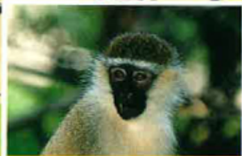
Lo monardet verdòt