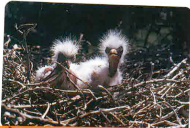
Dos poletons de bernats espèran que los vièlhs tornen.

Cada an, del mièg del mes d'abril al mes de julhet, los aucèls s'afanan. Es lo periòde de la nidificacion, lo moment que las femèlas e los mascles se tornan trobar per s'acoblar e far los nises. Cada aucèl son nis !