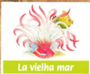
La vielha mar