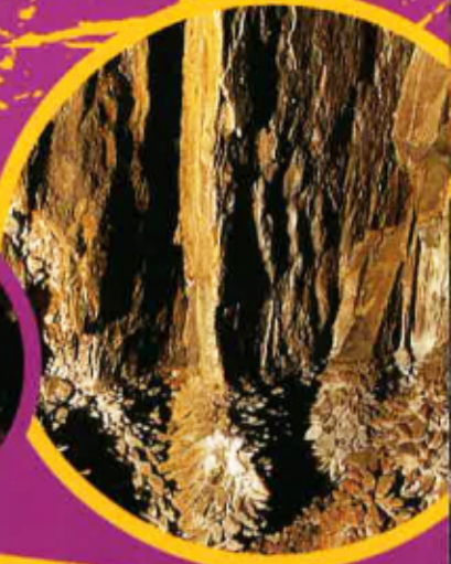
Vesi lèu los primièrs cristals de calcita al pè d'una paret de ròc.

L a bauma es coneguda dempuèi 1882, malurosament, la protegiguèron pas a aquela epòca e las primièras salas foguèron afrabadas. Aquò's pas qu'en 1965 qu'un mainatge de 12 ans, amb lo seu paire, descobriguèron la segonda partida de la bauma. Ara es protegida, l'accès n'es reglamentat e se pòt pas visitar qu'amb un guida diplomat.