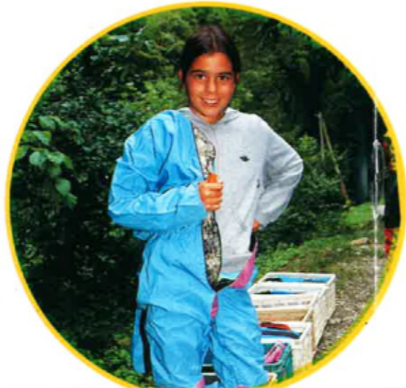
Una combinason estanca li permetrà d'avancar sens se passir. Lo casco equipat d'una lampa li apararà lo cap.

« Finissi per arribar dins la bauma. A d'endrech que i a, es plan bassa. Urosament qu'ai lo casco ! » « M'engulhi dins una falha estrecha. Compreni perquè me cal la combinason. »