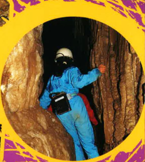
Tèxte e fotografias de Fred Lavail