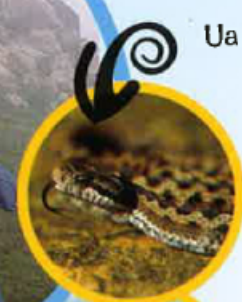
Ua vipèra aspic