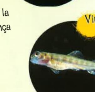
Vint-e-cinc jorns après la naissença