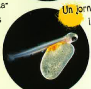
Un jorn après la naissença