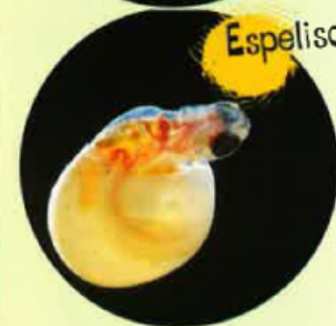
Espelison a quaranta-cinc jorns