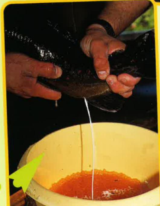
Tèxte e fotografias de Fred Lavail

A puèi, Thierry atrapa qualques mascles. Lor catcha sul ventre tanben per far sortir un liquide blanc : lo lach. Es aital que s'apèla lo semen dels peisses ont se tròban los espermatozòides. Son eles que van fecondar los uòus. La fecondacion se fa en un quart d'ora.