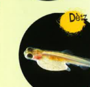
Dètz jorns après la naissença