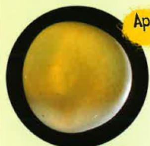
Après vint jorns