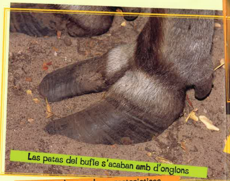
Las patas del bufle s'acaban amb d'onglons

Quand son dins d'endrechtes ont son pas protegits sòrton puslèu de nuèch.