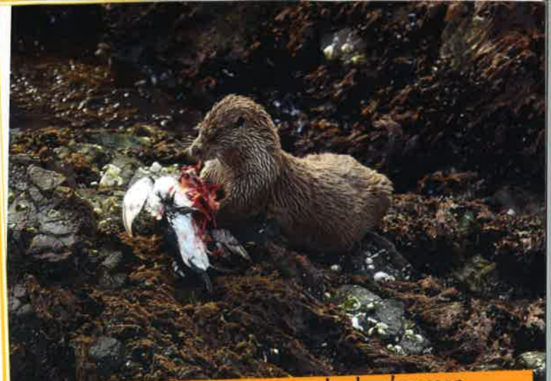
La loira es curiosa e li agrada de s'amusar.

L as loiras sòrton la nuèch mai que mai. Daissan de traças suls ròcs o sus las socas dels arbres per marcar lor territòri. Son de crotarèlas que senton a peis. Dins aqueles excrements, i se tròba d'arestas e d'escalhas de peis. Arriba que i aja de loiras sus la còsta atlantica. Pòdon caçar los aucèls que son pas pro prudents.