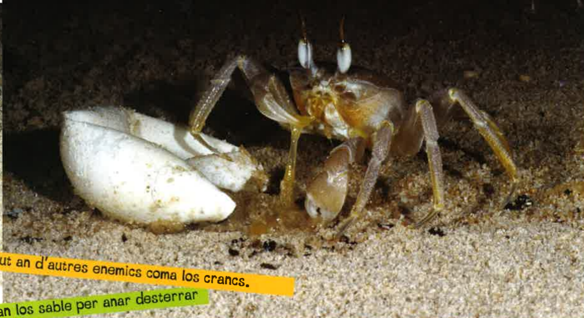
Las tortugas lut an d'autres enemies coma los crancs.