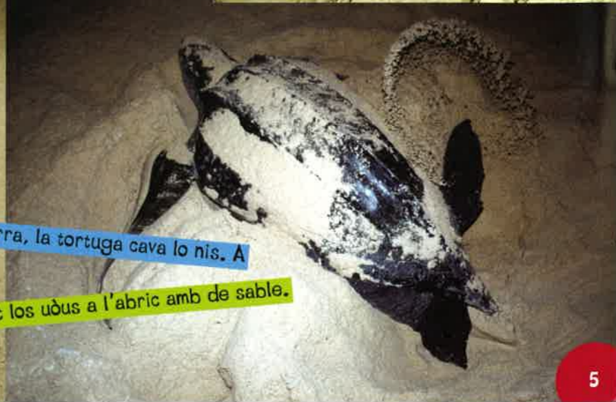
drecha, met los uòus a l'abric amb de sable.