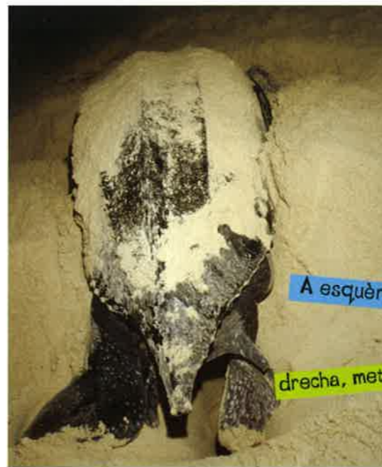
A esquèrra, la tortuga cava lo nis. A