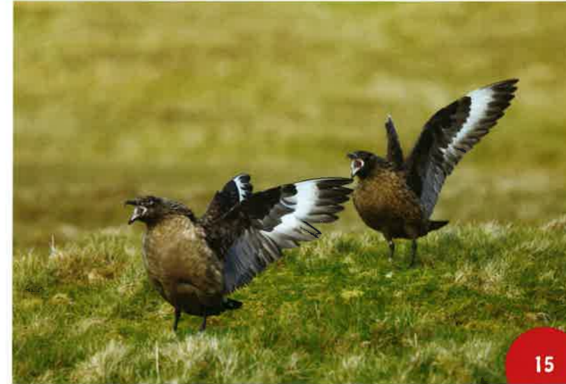
Tèxte e fòtos Fred Lavail