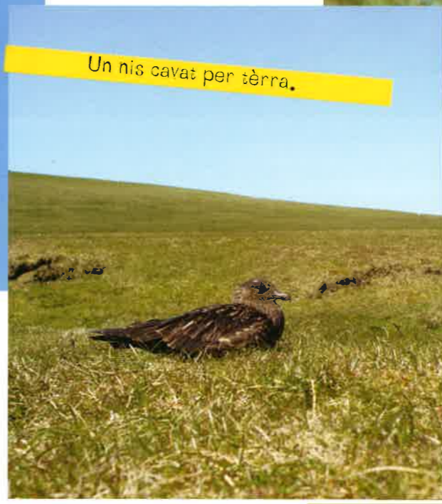
Un nis cavat per tèrra.