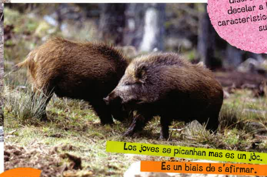
Los joves se picanhan mas es un jòc.

Los singlars vivon en tropa. Pr'aquò qualques mascles pòdon viure sols. Per s'afirmar e per se mesurar, los mascles joves se picanhan e mai se baton, mas sens se far mal.