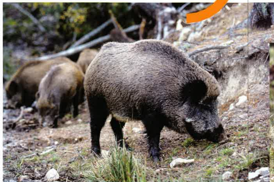
Tèxte e fòtos Fred Lavail

Amb lo morre, modilhan lo sòl per trobar de vèrms, d'agland, de mirguetas, de raices, d'escargòls, de frucha o de camparòls.